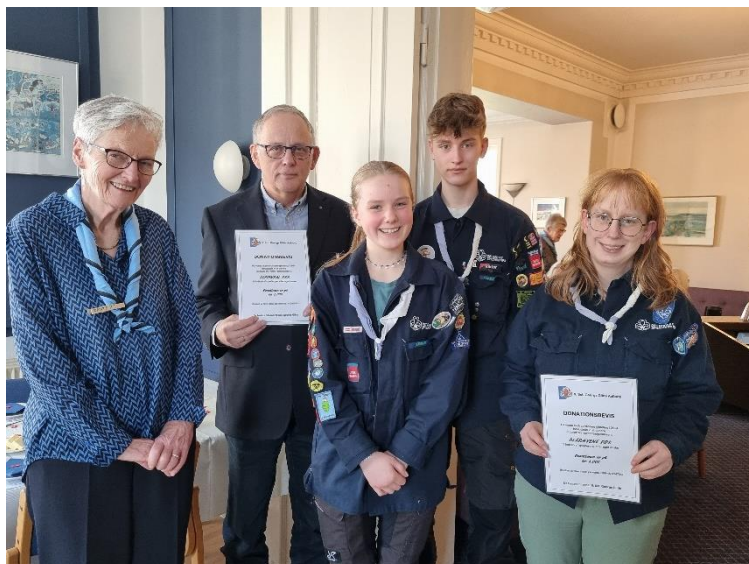
Overrækkelse af donationer i anledning af 9. Gildes 60-års fødselsdag