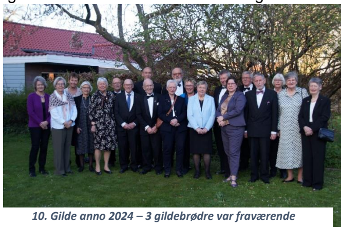
10. Gilde anno 2024 – 3 gildebrødre var fraværende

Herefter blev Gildehallen lukket og ledelse og gildebrødre forlod gildehallen til tonerne: Limelight