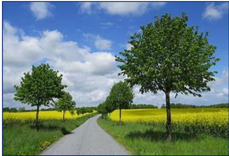
Forår i Danmark