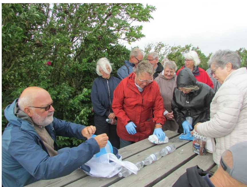
En lille forfriskning i Stauning Havn i stormvejr